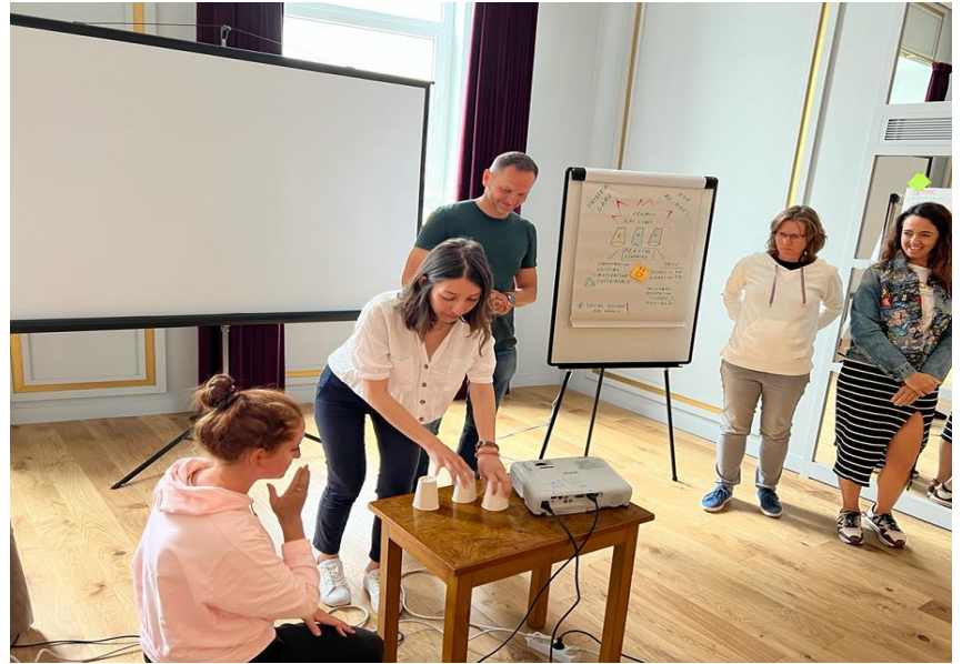
Ομαδική εργασία μετάδοση σωστού μηνύματος