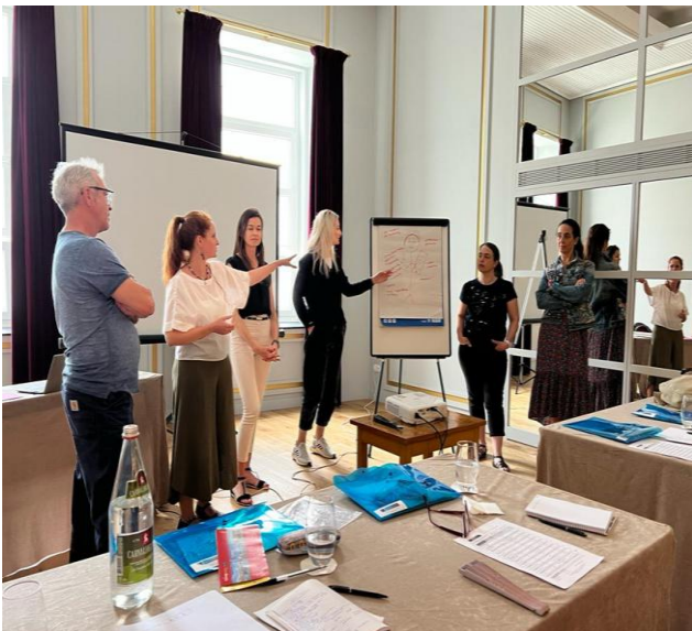
Ομαδική εργασία για το πρότυπο του καθηγητή