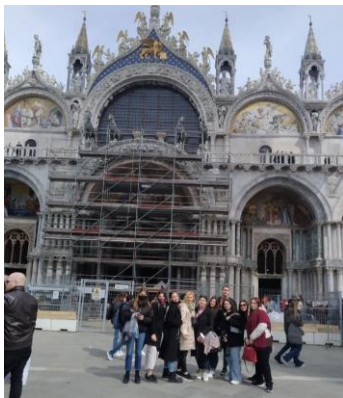
Άγιος Μάρκος Βενετία

Οι εκδρομές μας στη Λίμνη Κόμο, στο Μπέργκαμο και στην Βενετία ολοκλήρωσαν την υλοποίηση του πολιτιστικού σχεδιασμού των δράσεών μας.