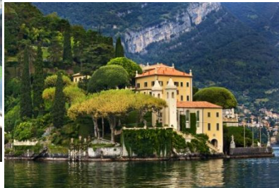
Κρουαζιέρα στη Λίμνη Κόμο