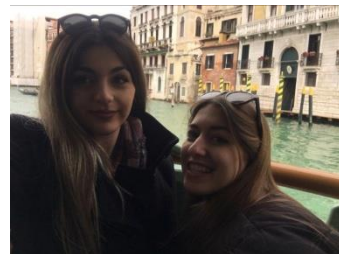
Grande Canale Βενετία

Τα καταλύματα που είχαν επιλεγεί ήταν ασφαλή με πλήρη ηλεκτρολογικό εξοπλισμό που εξυπηρέτησε τις ανάγκες των συμμετεχόντων όλο το διάστημα που παρευρέθηκαν στο Μιλάνο.